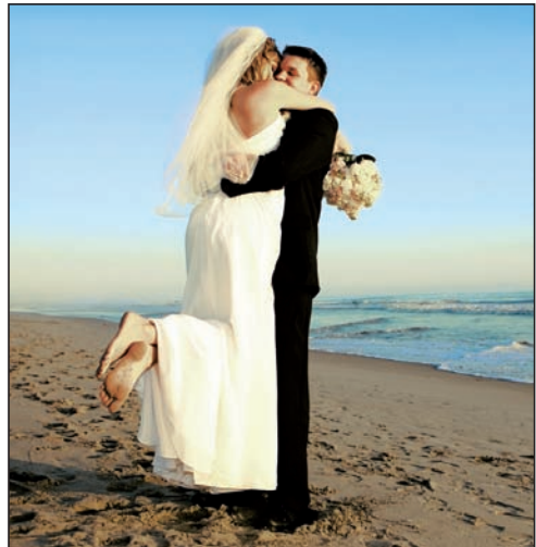
Auch am Strand gilt: »Sie dürfen die Braut jetzt küssen!«

Westerland. »Ja, ich Hochzeitsinsel. Rund um die Königin der Nordsee und der schönste Tag im Leben passen eben ideal zusammen. Unendliche Möglichkeiten. Ja, ich will – ob traditionell auf dem Standesamt, romantisch am Strand oder abenteuerlich mit einem Fallschirmsprung. Nichts ist unmöglich. Jedenfalls dann nicht, wenn man die richtigen Leute für solche Zeremonien kennt. Die absoluten Profis.