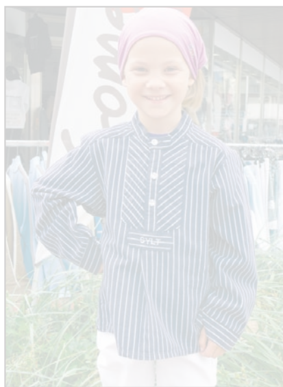
Einfach klasse, dieses flotte Fischerhemd!

den absolut authentisch. Und wer seine Liebe zur Insel deutlicher demonstrieren möchte, wählt jene Teile mit Aufschriften wie »Verliebt in Sylt«, »Sylt love you«.